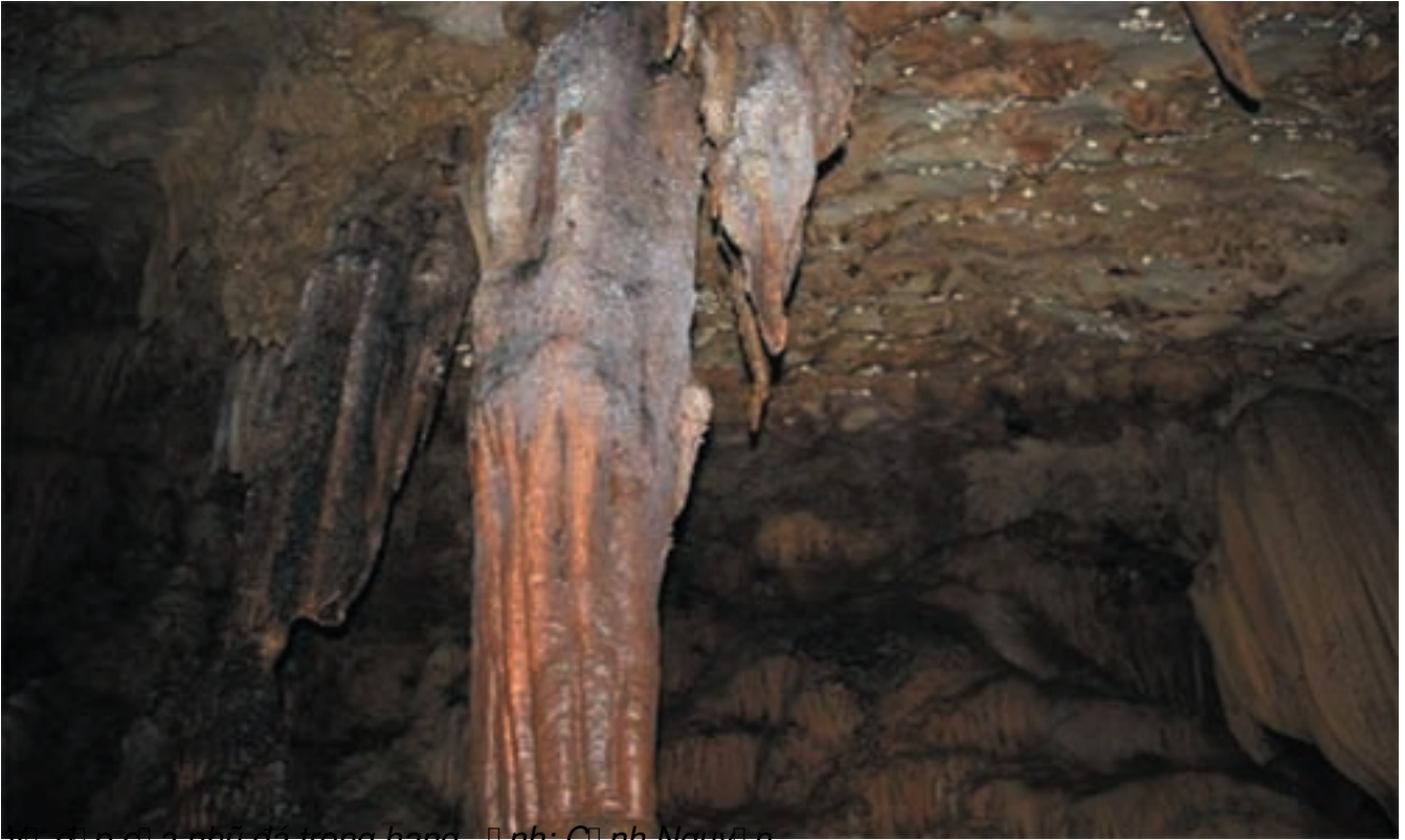
Vết dấu p cá a như da trong hang - Ảnh: Công Nh Nguyễn